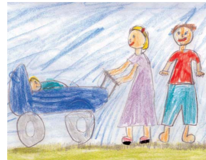
Ein Kind kann für Drogenabhängige für den Aufbruch in ein neues Leben stehen.

Kids & Co heißt ein Bielefelder Netzwerk, an dem auch das Team Sucht des Fachbereichs Lebensräume beteiligt ist. Es verbessert die Situation drogenabhängiger Eltern und ihrer Kinder