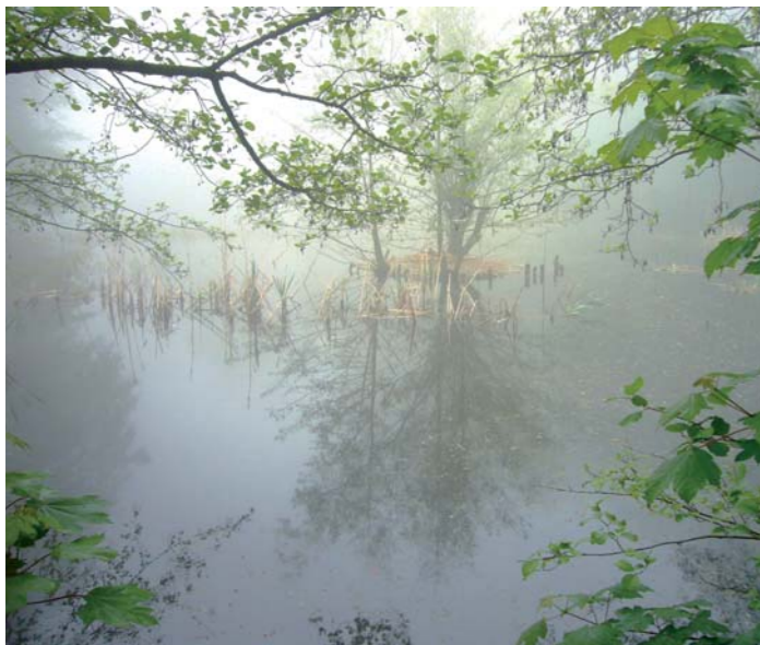
Mystische Stimmung: Rohrweiher im Nebel.

Wolfgang Röhrig stellt Bilder im Café Komm aus. Der Verwaltungsmitarbeiter ist ein Fotograf mit einem großen und genauen Blick auf Landschaften