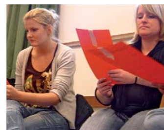
Der kritische Blick danach: Was haben die anderen über mich geschrieben?

Die Workshops im Kolleg weisen die SchülerInnen nicht nur auf professionelle Hilfsangebote wie die Beratungsstelle hin, sie geben auch ganz praktische Werkzeuge an die Hand, um in Zukunft besser auf sich achten zu können.